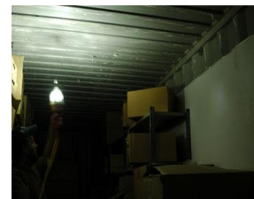
With the EHL-LED-120X12-100

Cette lampe à main LED à haute efficacité qui ne nécessite pas de ballast, donc l'opérateur n'a pas besoin de faire glisser le boîtier du ballast autour. Cela peut être particulièrement gênant lorsque le ballast s'emmêle dans le cordon. Un transformateur inclus en ligne permet à cet appareil à brancher sur une prise de courant standard et de 120-277VAC.